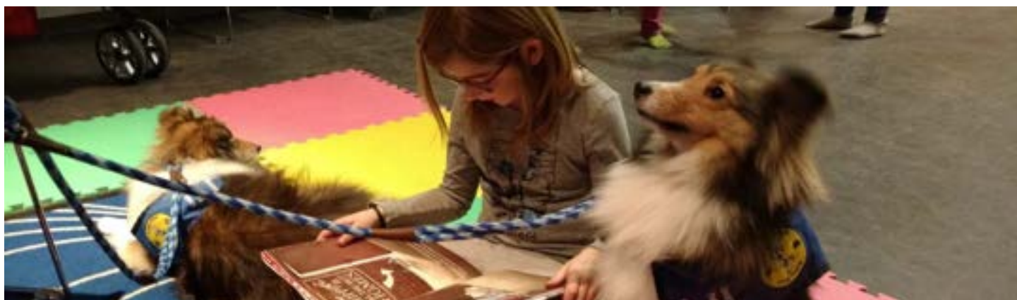
Club de lecture des quatre pattes