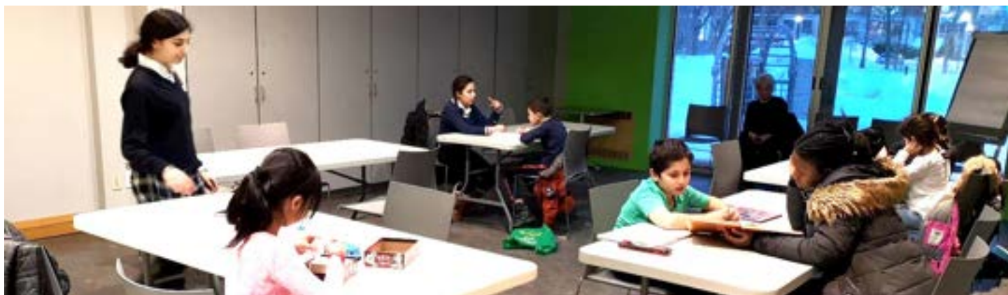
Aide aux devoirs

En 2018, la bibliothèque a offert un piano demi-queue à ses membres. Les résidents peuvent donc s'exercer sur un instrument de qualité, et c'est également excellent pour le piano.