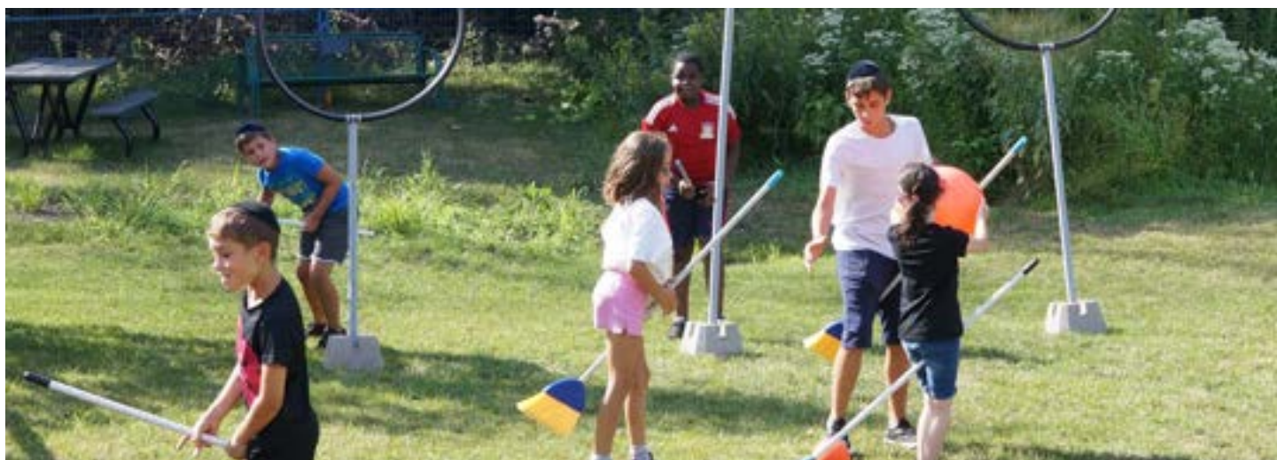
Fête d'anniversaire pour Harry Potter