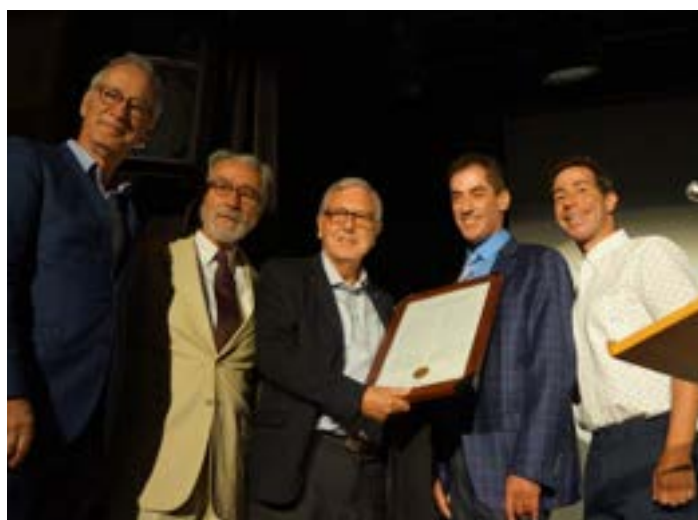
250e anniversaire de la Synagogue Spanish and Portuguese