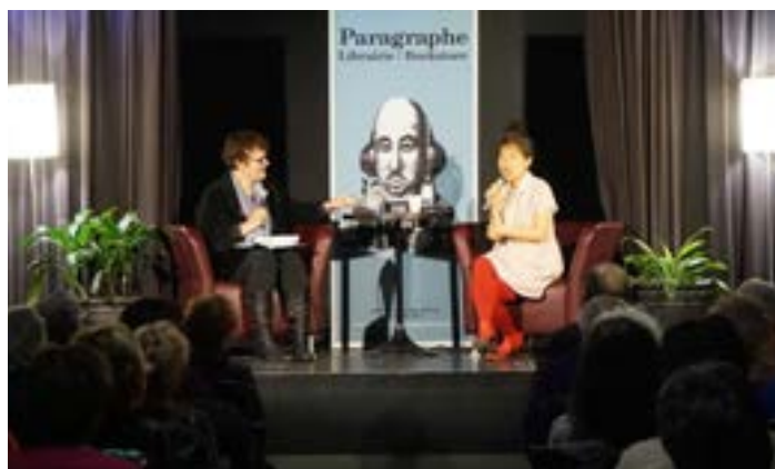
Une soirée avec Kim Thúy